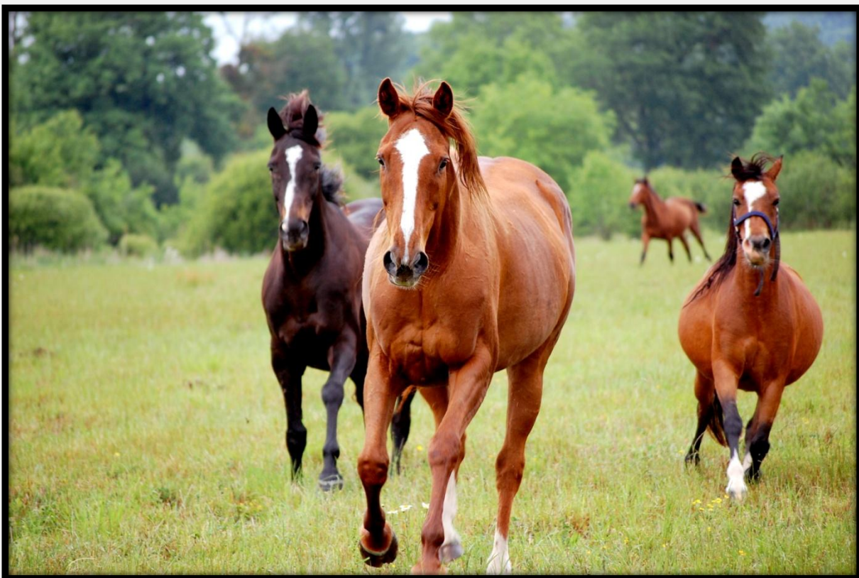
Les crins de liberté